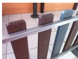
détail finition dos barrière