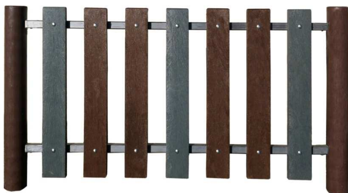
Module S basic 1450mm (7 lattes) + 1 poteau de finition