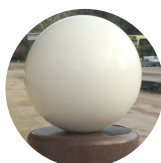
Option boule thermo laquée