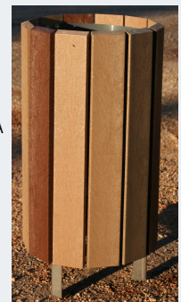
MODELE BICOLORE Marron/Ivoire