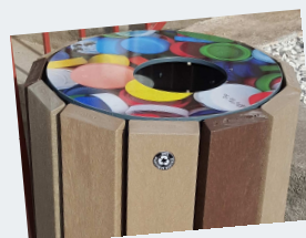
Couvercle réducteur sur modèle bicolore